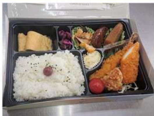
おまかせ弁当 800 円~