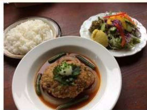
ハンバーグセット 赤ワイン風味 or 和風 (菜園サラダ、ライス付) 1,026 円