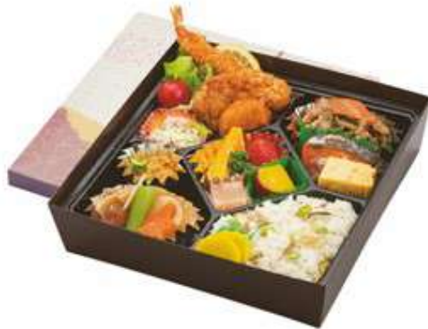
特製幕の内弁当 1,720 円