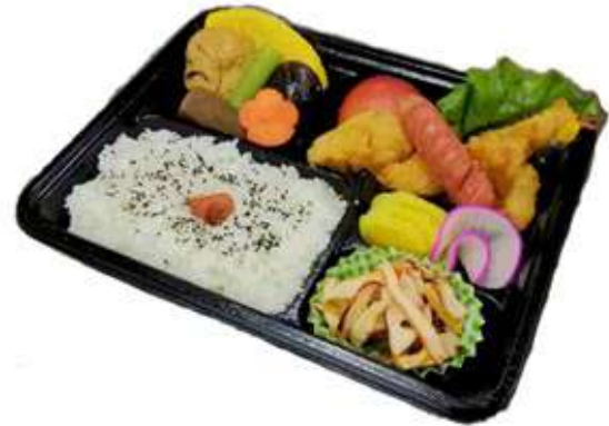
② 幕の内弁当B 700 円