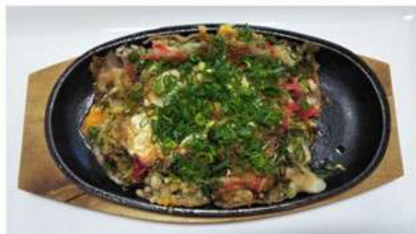
とん平焼き 700 円