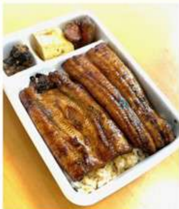
うな丼(上) 3,000 円