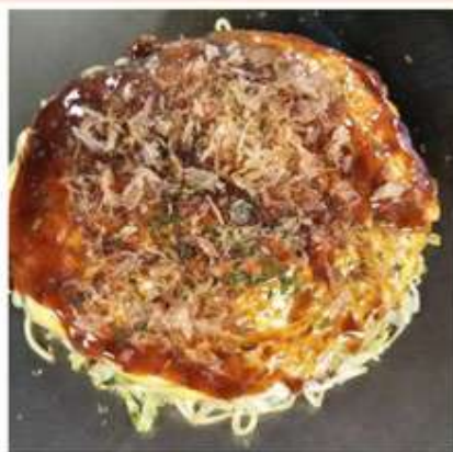
スペシャルそば 1,050 円