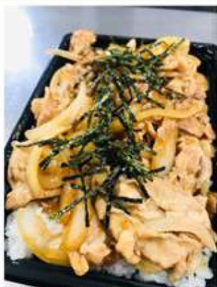
生姜焼き弁当 700 円