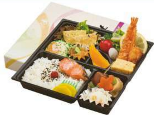
幕の内弁当 1,180 円