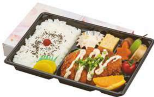
ボリューム弁当 964 円