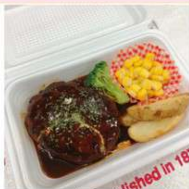
ハンバーグセット ミニサラダ付 (ソース3種の中より) 1,100 円