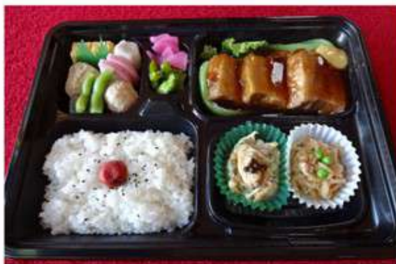
③ 豚の角煮弁当 756 円