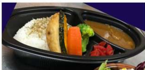
おまかせカレーライス 800 円 (前日までの予約)