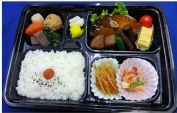
① 煮魚弁当 756 円