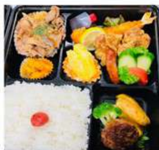
日替わり幕の内弁当 (配達日の前日までに要予約、 当日になってしまった時は要相談) 1,100 円