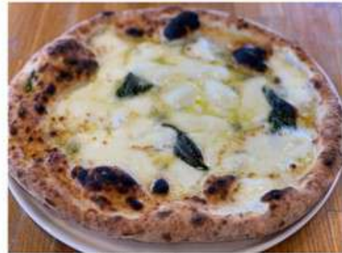
4種チーズクワトロフォルマッジ ハチミツ付き 2,110 円