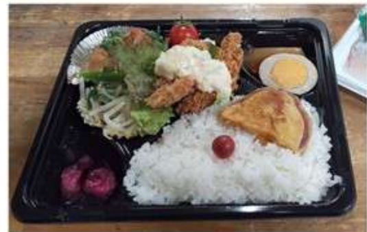
日替わり弁当（お昼のみ） お弁当の内容は日によって変わります。 550円