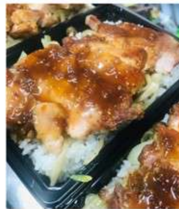
豚弁当 700 円