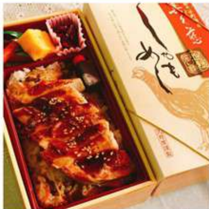
奥久慈しゃもめし 1,100円