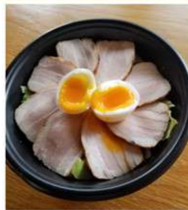
手作りローストポーク丼 1,000 円