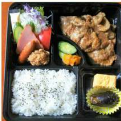
しょうが焼弁当 1,000円