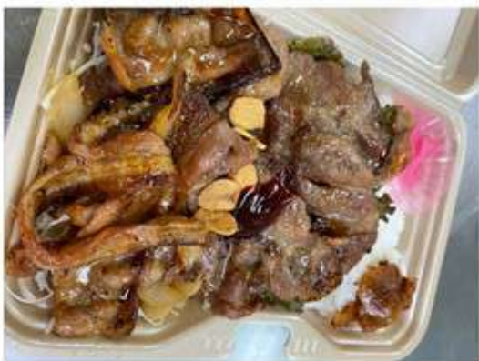
焼肉弁当 700 円