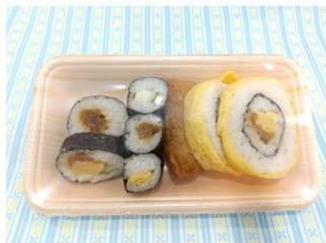
寿司 (いなり・のりまき) 300 円