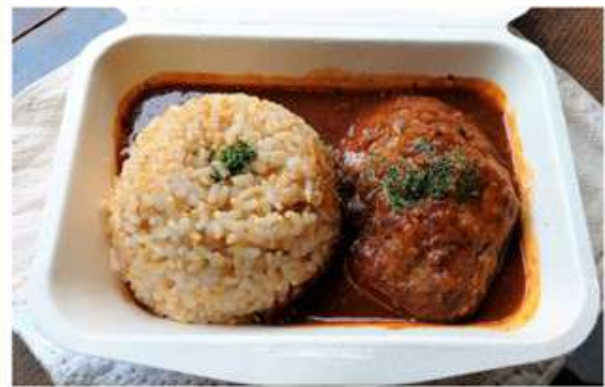
煮込みハンバーグ 700円