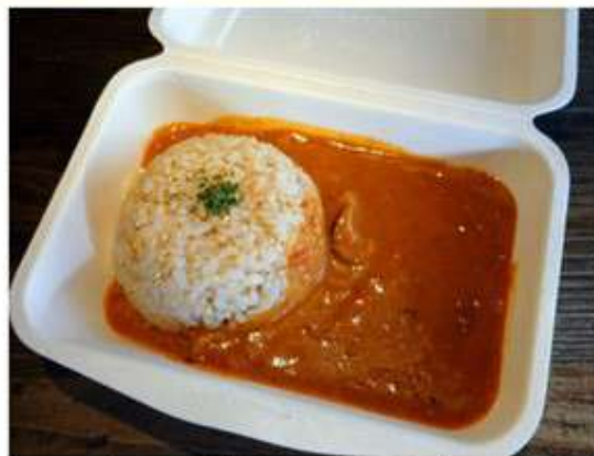
奥久慈しゃもカレー 700円