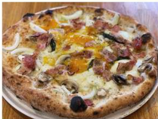
しゃもの玉子とベーコンのビスマルク 1,936 円