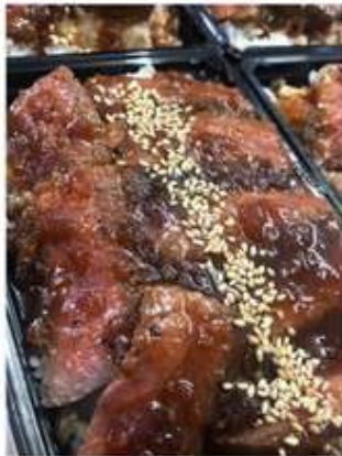
牛弁当 1,000 円