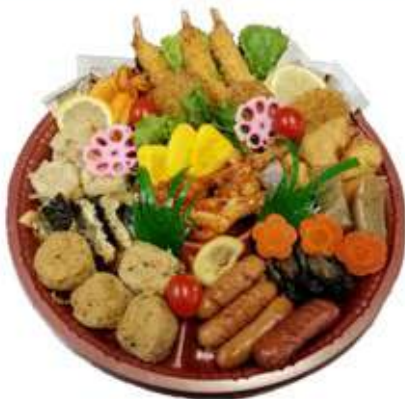
③ オードブル(4~5人前) 3,000 円~