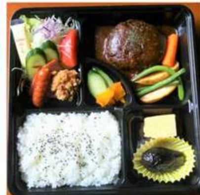
ハンバーグ弁当 1,000円