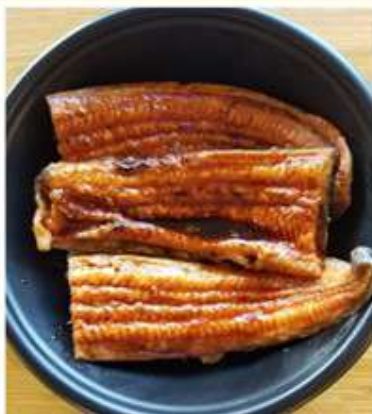
特上うな丼 1,800 円