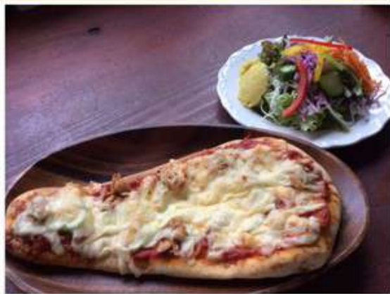
本日のピザセット (菜園サラダ付) 1,242 円