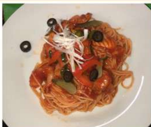
ピリ辛海鮮パスタ 970 円