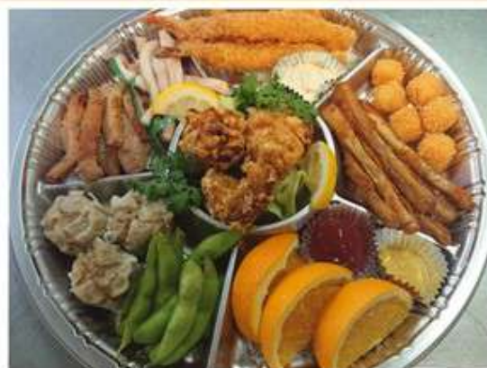
オードブル 3,240 円