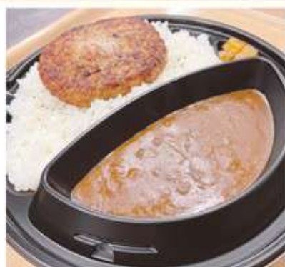
カレー ミニサラダ付 (ハンバーグカレー or ロースカツカレー) 1,150 円