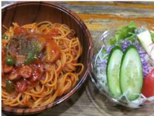
パスタ(サラダ付) 800円