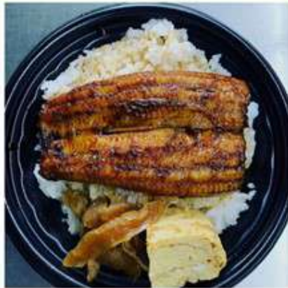
うな丼弁当 1,500 円