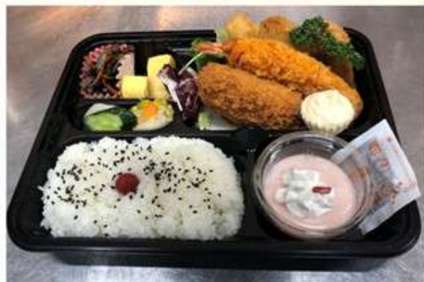
おまかせ弁当 800 円 (前日までの予約)