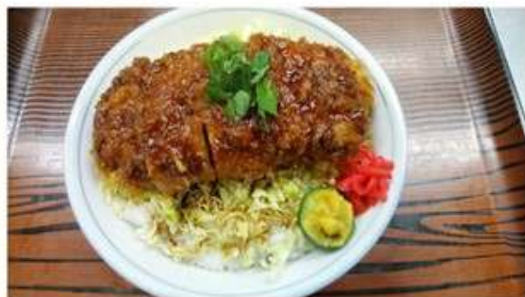
ソースカツ丼 850 円 (前日までの予約)