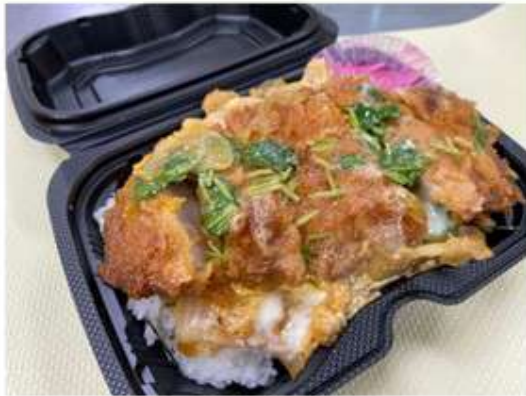
カツ丼弁当 750 円