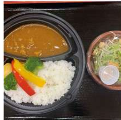
やみぞ特製カレー 800 円