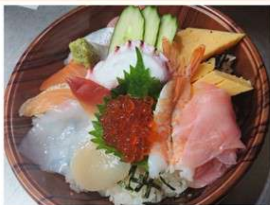
海鮮丼 1,200 円