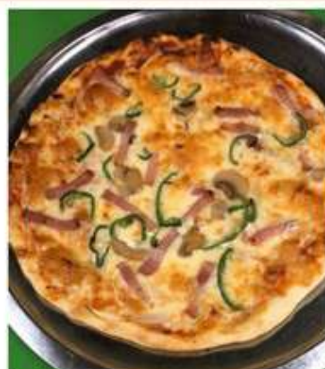
ピザ 980 円