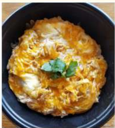
特上しゃも丼 1,100 円