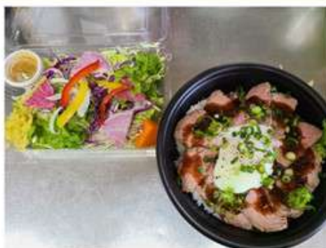
自家製ローストビーフ丼 (菜園サラダ付) 1,382 円