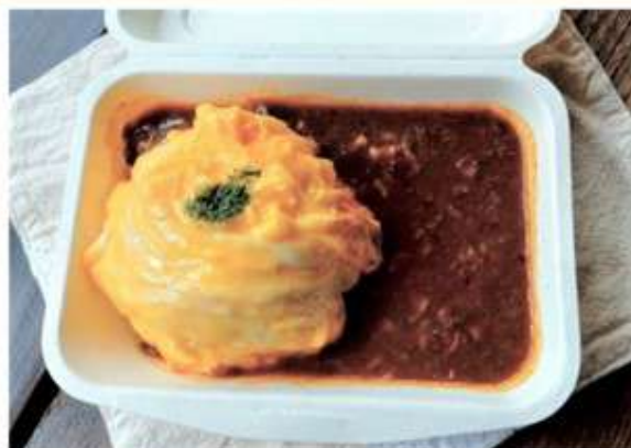
奥久慈しゃも玉テミオムライス 700円