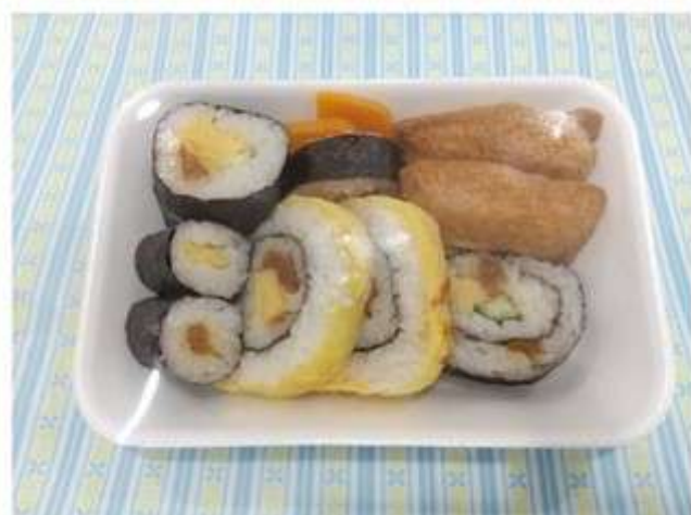
寿司詰合せ (いなり・のりまき他) 450 円