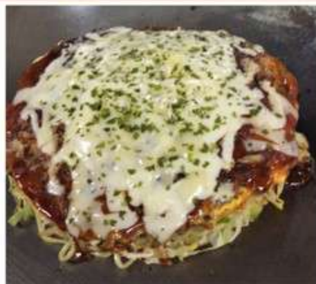
チーズスペシャルそば 1,180 円