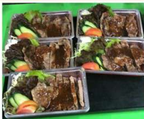
ステーキ (1パック) 1,760 円