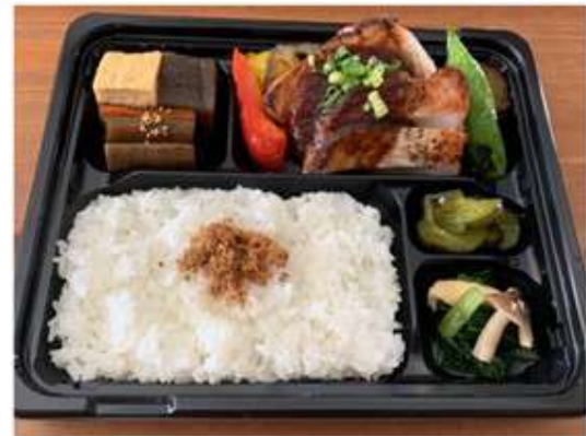
オトナリ弁当 800 円