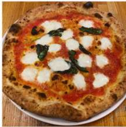
マルゲリータエクストラ 2,110 円