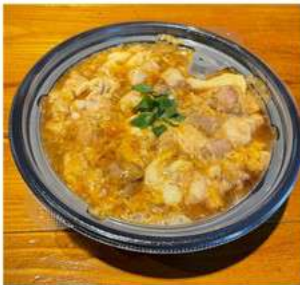
奥久慈しゃも親子丼 1,050 円