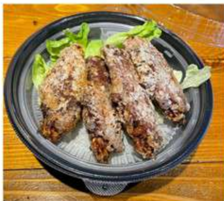
奥久慈しゃも唐揚げ定食 1,200 円