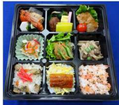
② 彩り弁当 864 円