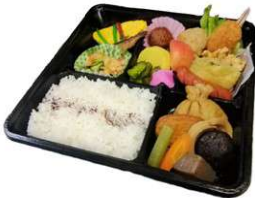
① 幕の内弁当A 1,000 円