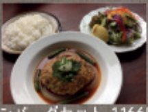
ハンバーグセット 1,166円 赤ワイン風味 or 和風 (菜園サラダ・ライス付)