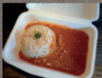
奥久慈しゃもカレー 800円