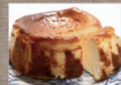
バスクチーズケーキ 2,500円

↑ 奥久慈プリン6個入 1,965円 ← 久慈川の氷華餅 10個入 2,062円