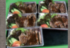
ステーキ (1パック) 1,760円