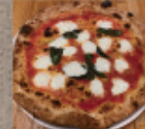
マルゲリータエクストラ 2,110円