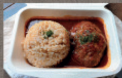
煮込みハンバーグ 800円