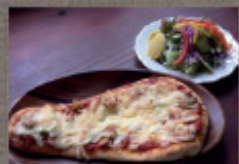
本日のピザセット (菜園サラダ付) 1,350円