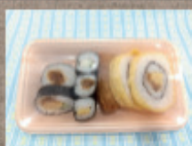
寿司 320円 (いなり・のりまき)