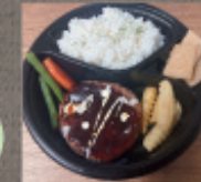
常陸牛ハンバーグ弁当 1,200円 (おろしポン酢に変更可)