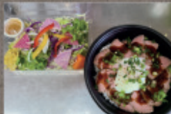
自家製ローストビーフ丼 (菜園サラダ付) 1,458円