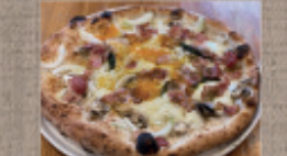
しゃも玉子とベーコン のビスマルク 1,936円