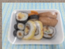
寿司詰合せ 480円 (いなり・のりまき他)