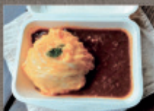
奥久慈しゃも玉 デミオムライス 800円