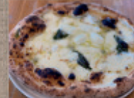
4種チーズクワトロ フォルマッツ ハチミツ付ま 2,110円