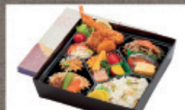
特製幕の内弁当 1,720円