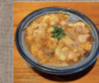
奥久慈しゃも親子丼 1,330円