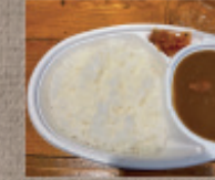
奥久慈しゃもカレー 1,220円