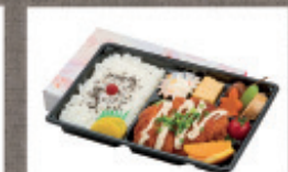
ボリューム弁当 964円