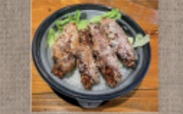
奥久慈しゃも唐揚げ定食 1,570円