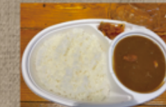
奥久慈しゃもカレー 1,220円