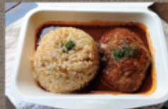
煮込みハンバーグ 800円