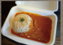
奥久慈しゃもカレー 800円

daigo cafe ☎ 76-8755 定休: 水曜 注文受付 11~16:00 お届け 11~17:00