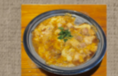
奥久慈しゃも親子丼 1,330円

奥久慈しゃも料理 だいこん ☎ 76-8002 定休: 日・月曜 注文受付 前日17~20:00 お届け 17:00~