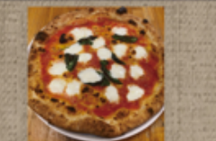
マルゲリータエクストラ 2,110円

ピッツェリア コゾー ☎ 76-8880 不定休 注文受付 11~16:00 お届け 11~17:00