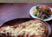
本日のピザセット (菜園サラダ付) 1,350円

フランボワーズ ☎ 72-0739 定休: 火曜・第3月曜 注文受付 10:30~16:00 お届け 11~17:00