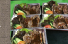
ステーキ (1パック) 1,760円

魚兼 ☎ 72-0146 定休: 日曜 (土曜のテイクアウトは休み) ご注文は2個~ 注文受付 10~17:00 お届け 17:30~