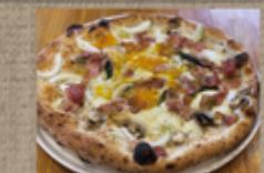
しゃもの玉子とベーコンのビスマルク 1,936円

鄙の庭 きん彩 ☎ 76-8118 定休: 木曜 注文受付 10~12:00 お届け 11:30~14:00