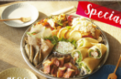
Special オートフル 4,500円

咲くカフェ ☎ 76-8320 定休: 月・火曜 注文受付 9~21:00 お届け 11:00~