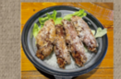
奥久慈しゃも唐揚げ定食 1,570円

花まる ☎ 76-8488 定休: 月・火曜 ご注文は前日 12:00まで お届け 11~12:30