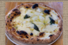
4種チーズクワトロ フォルマッジ ハチミツ付き 2,110円