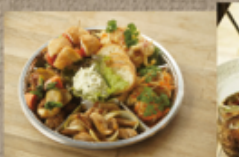
ディナーオートフル 3,300円