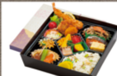
特製幕の内弁当 1,720円

こんにやく関所 ☎ 77-5011 不定休 ご注文は3個~ 注文受付 前日10:00まで お届け 11~15:00