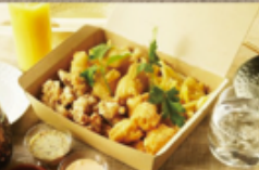
パーティーフライBox 1,850円

フランボワーズ ☎ 72-0739 定休: 火曜・第3月曜 注文受付 10:30~16:00 お届け 11~17:00