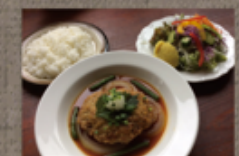
ハンバーグセット 1,166円 赤ワイン風味 or 和風 (菜園サラダ・ライス付)