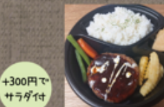
常陸牛ハンバーグ弁当 1,200円 (おろしポン酢に変更可)

トゥーリー ☎ 76-8844 定休: 月・火曜 ご注文は前日までの 9~11:00 / 14~16:00 お届け 11~12:00 / 16~17:00