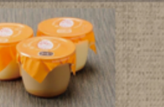
↑ 奥久慈プリン6個入 1,965円 ← 久慈川の氷華餅 10個入 2,062円