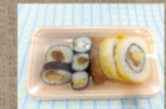
寿司 320円 (いなり・のりまき)