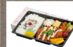
ボリューム弁当 964円

ふじまるや ☎ 72-1363 定休: 月曜 ご注文は5個~ 注文受付 前日10~15:00 お届け 11:30~12:30