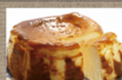
バスクチーズケーキ 2,500円

ピッツェリア コゾー ☎ 76-8880 不定休 注文受付 11~16:00 お届け 11~17:00