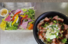
自家製ローストビーフ丼 (菜園サラダ付) 1,458円

トゥーリー ☎ 76-8844 定休: 月・火曜 ご注文は前日までの 9~11:00 / 14~16:00 お届け 11~12:00 / 16~17:00