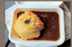
奥久慈しゃも玉 デミオムライス 800円

こんにやく関所 ☎ 77-5011 不定休 ご注文は3個~ 注文受付 前日10:00まで お届け 11~15:00