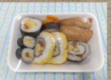
寿司詰合せ 480円 (いなり・のりまき他)

ふじまるや ☎ 72-1363 定休: 月曜 ご注文は5個~ 注文受付 前日10~15:00 お届け 11:30~12:30