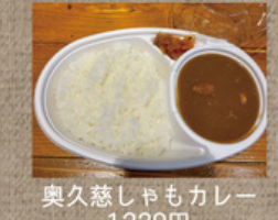
奥久慈しゃもカレー 1,220円