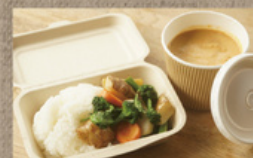
奥久慈しゃもの レッドスパイスカレー 750円