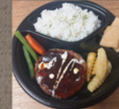
常陸牛ハンバーグ弁当 1,200円 (おろしポン酢に変更可)