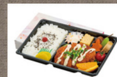
ボリューム弁当 964円