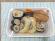
寿司詰合せ 480円 (いなり・のりまき他)