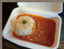
奥久慈しゃもカレー 800円