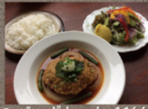
ハンバーグセット 1166円 赤ワイン風味 or 和風 (菜園サラダ・ライス付)