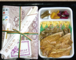
玉屋の奥久慈しゃも弁当 1,200円