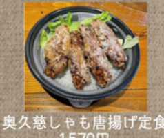
奥久慈しゃも唐揚げ定食 1,570円