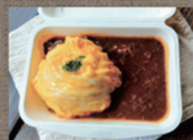
奥久慈しゃも玉 デミオムライス 800円