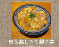
奥久慈しゃも親子丼 1,330円