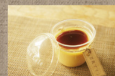
ぬっとり豆乳スリン 350円