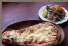
本日のピザセット (菜園サラダ付) 1,350円