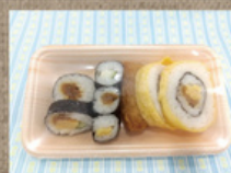
寿司 320円 (いなり・のりまき)