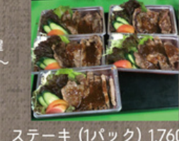
ステーキ (1パック) 1,760円