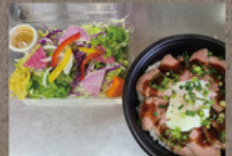
自家製ローストビーフ丼 (菜園サラダ付) 1,458円