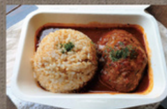
煮込みハンバーグ 800円