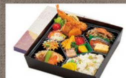
特製幕の内弁当 1,720円