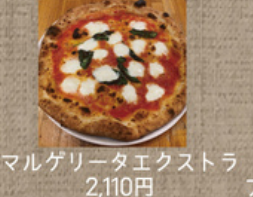
マルゲリータエクストラ 2,110円