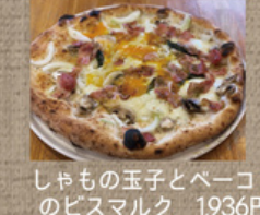
しゃもの玉子とベーコン のビスマルク 1,936円