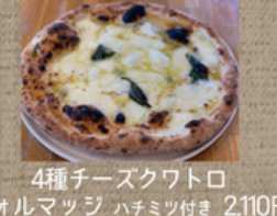
4種チーズクワトロ フォルマッジ ハチミツ付き 2,110円