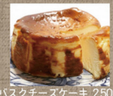
バスクチーズケーキ 2,500円

↑ 奥久慈プリン6個入 1,965円 ← 久慈川の氷華餅 10個入 2,062円